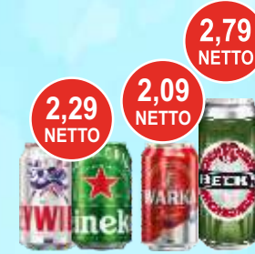
Piwo puszkowe Żywiec, Heineken, Warka i Beck's puszka 0,5 L