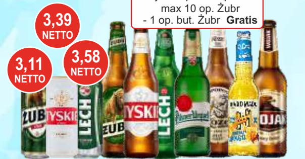
Piwo Żubr, Tyskie, Lech, Koziel, Wojak, Dębowe but., puszka 0,5 L, Hardmade 0,4 L

Przy zakupie 12 op. mix 1 op. Tatry puszki Gratis