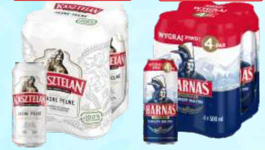
Piwo puszkowe Kasztelan, Harnaś 0,5 L czteropak

Przy zakupie 20 zgr. w czteropak 1 zgr. Harnaś Gratis