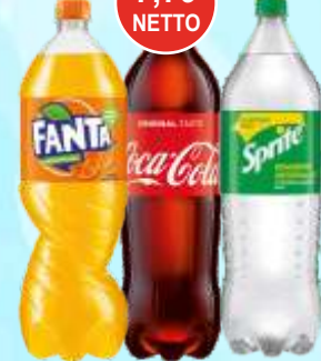
Napoje Coca Cola Fanta i Sprite 2 L