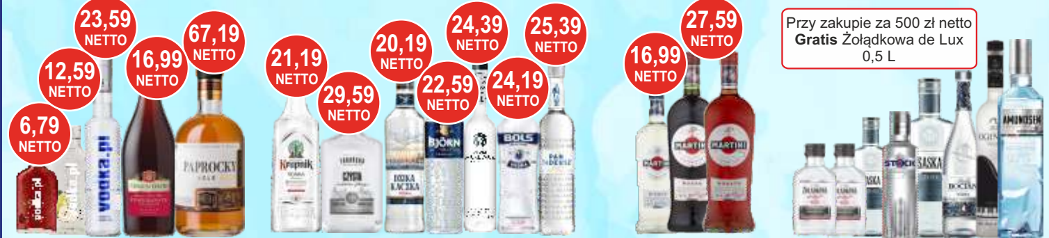
Wódka Wódka PL kolory 40% 0,1; 0,2 i 0,5 L, Wino Mogen David 0,75 L i Whisky Paprocky 0,7 L Wódka Dzika Kaczka, Mickiewicz, Björn Premium, Toruńska, Krupnik, Bols, Pan Tadeusz Wino Martini 0,5 L i 1 L białe, czerwone i różowe Wódka 0,1; 0,2; 0,5 i 0,7 L, Biały Bocian, Ogiński, Amundsen, Saska czysta, Stock Prestige, Żołądkowa de Lux (bez 0,5 L)

Przy zakupie za 500 zł netto Gratis Żołądkowa de Lux 0,5 L