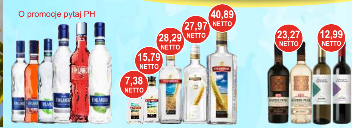
Wódka Finlandia 0,5 i 0,7 L czysta i kolorowa Wódka Stumbras 0,1; 0,2; 0,5 i 0,7 L i Stumbras Festive Edition 0,5 L Wino Gruzińskie 0,75 L Kazbek, Georgian Ornament (białe, czerwone)

Przy zakupie za 300 zł netto mix 0,1; 0,2 i 0,5 L Gratis Żołądkowa gorzka z miętą 0,2 L