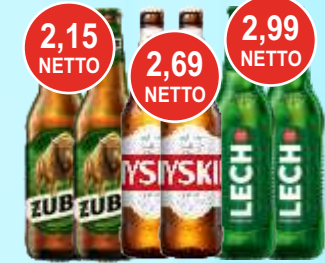
Piwo Żubr, Tyskie i Lech 0,5 L

* Dla klientów z umową * Nie łączymy promocji