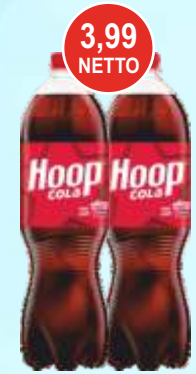
Napoje Hoop Cola 2 L