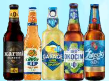
Piwo Karmi 0%, Somersby 0%, Garage 0%, Okocim smakowy 0% Zatecký 0% - 0,4; 0,5 L

Przy zakupie 5 op. mix 1 op. piwa Calsberg 0,5 L Gratis