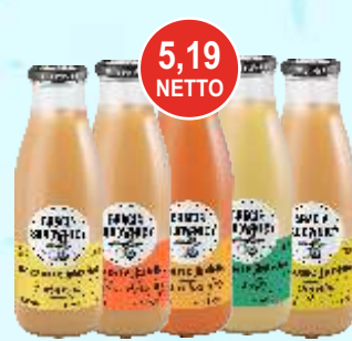
Soki 0,75 L Bracia Sadownicy (różne smaki)