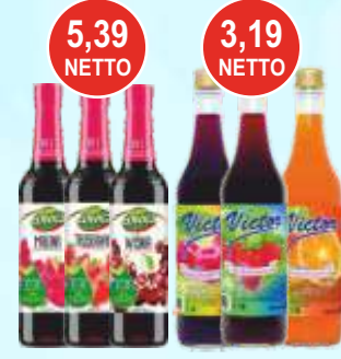
Syrop Łowicz 0,4 L i Victor 0,5 L (różne smaki)