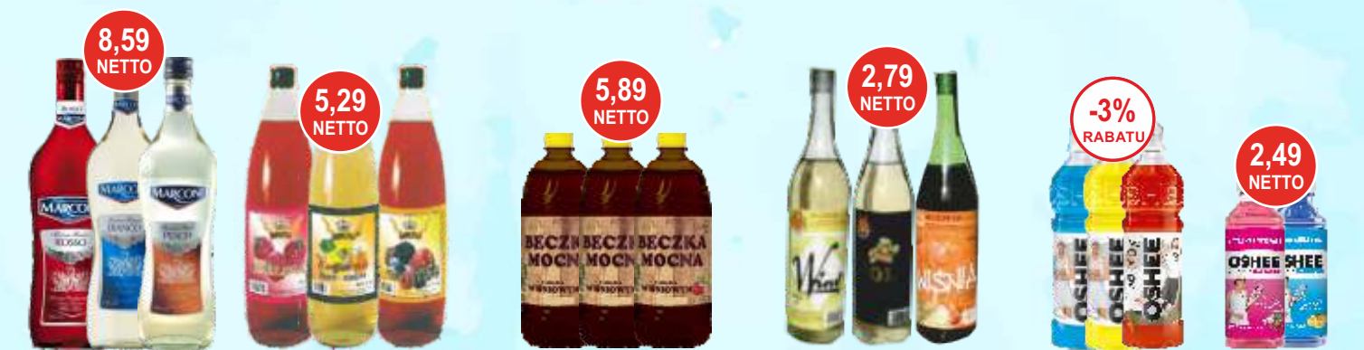
Wino Marconi 1 L (różne smaki) Nalewka Komplet 0,85 L różne smaki Nalewka Jantoni wiśniowa 0,9 L pet Wino Kolwin 0,67 L różne smaki Oshee 0,75 L Isotonic Drink (różne smaki) Oshee Water Witamin 0,555 L

* przy zakupie 4 op. - 4 pak Gratis 8 op. - 8 pak Gratis