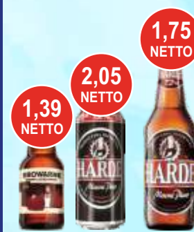
Piwo Browarne 0,33 L; Harde 0,5 L but., puszka

2,55 zł netto Kasztelan puszka w sześciopaku