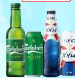
Piwo Calsberg but., puszka 0,5 L i Piwo Blanc 1664 but. 0,33 L i puszka 0,5 L

Przy zakupie 2 op. mix 1 op. - Gratis Zatecký 0% but.