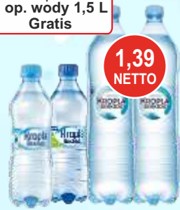
Woda Kropla Beskidu 0,5 L i 1,5 L

Przy zakupie 10 op. mix 1 op. wody 1,5 L Gratis