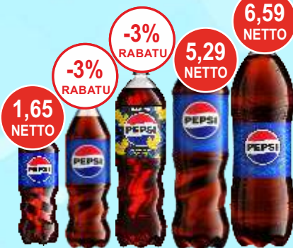
Napoje Pepsi 0,25, 0,5, 0,85, 1,5 i 2 L