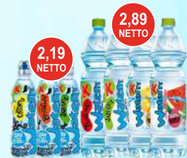
Woda Kubuś Water 0,5, L i 1,5 L (różne smaki)

2,99 netto do 3 op. 1 op. 0,555 L Gratis