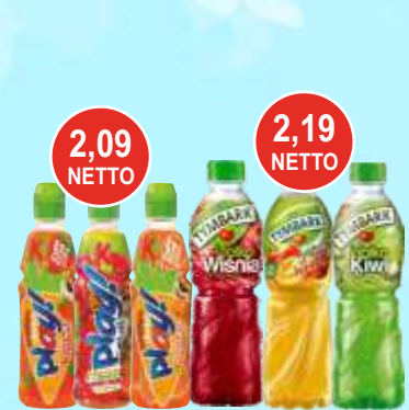
Kubuś Play 0,4 L i Tymbark Aseptic 0,5 L