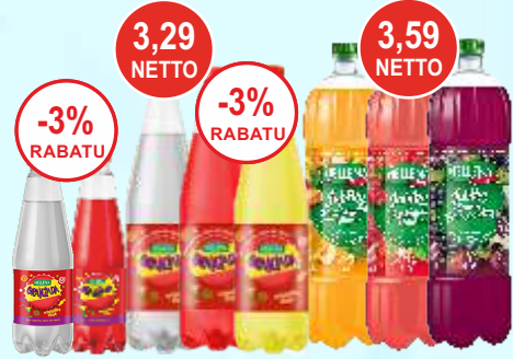
Napoje Hellena 0,4 L, 1,25 L gaz., 1,75 L n/gaz. i Hellena Cola 2 L