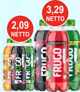
Napoje Frugo 0,5 L i 1,1 L (różne smaki)