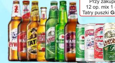
Piwo Żywiec, Warka, Tatra, Desperados, Heineken, Namysłów but., puszka

Przy zakupie 10 op. mix 1 op. Tatry but. Gratis