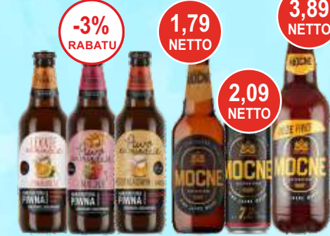
Piwo na miodzie z maliną, z pigwą, z imbirem, z aloesem, Piwo Mocne Eksportowe 0,5 L i 0,9 L