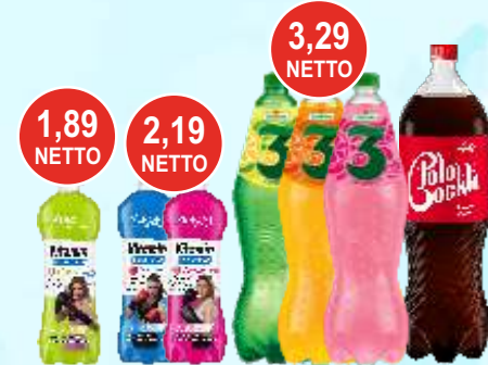
Napoje Zbyszko 1,75 L gaz., Polocockta 2 L i Woda Veroni z Witaminami 0,555 L