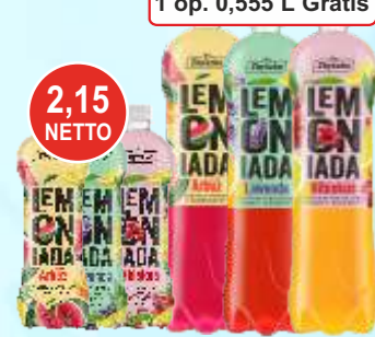
Napoje Zbyszko Lemoniada 0,555 L i 1,25 L (arbuz, hibiskus, lawenda)