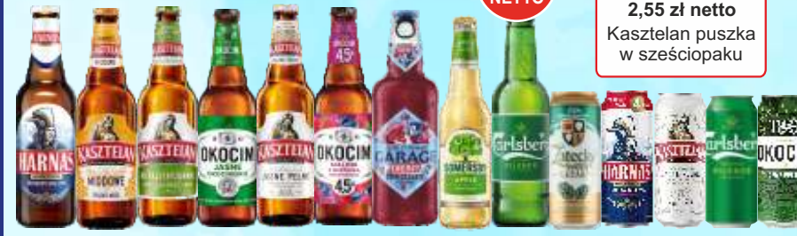
Piwo Harnaś, Kasztelan JP, Kasztelan n/past., Okocim JP, Karmi, Zatecký, Somersby, Okocim smakowy but., puszka 0,5 L

Przy zakupie 25 op. Kasztelan but. 1 op. Gratis