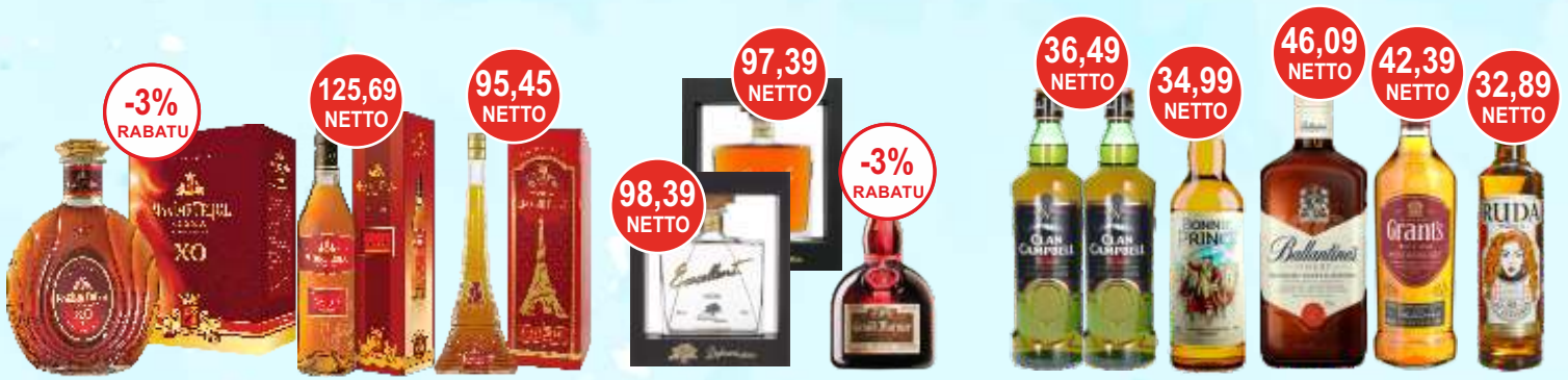
Cognac Maxime X.O. i Cognac V.S.O.P. Maxime 0,7 L, Very Special Eiffel Tower 0,5 L, Wódka Dębowa 0,7 L, karafka orzech i czysta i Likier Grand Marnier 0,7 L Whisky Clan Campbell 0,7 L; Bonnie Prince 0,7 L; Ballantine's; Grant's i Wódka Ruda 0,7 L