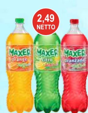
Napoje Maxer 2 L (różne smaki)