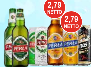
Piwo Perła but. puszka 0,5 L i Janosik mocny 0,5 L puszka

Przy zakupie 5 op. mix 1 op. szklanek Gratis