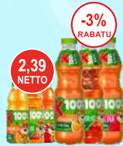
Kubuś 0,3 i 0,85 L (różne smaki)