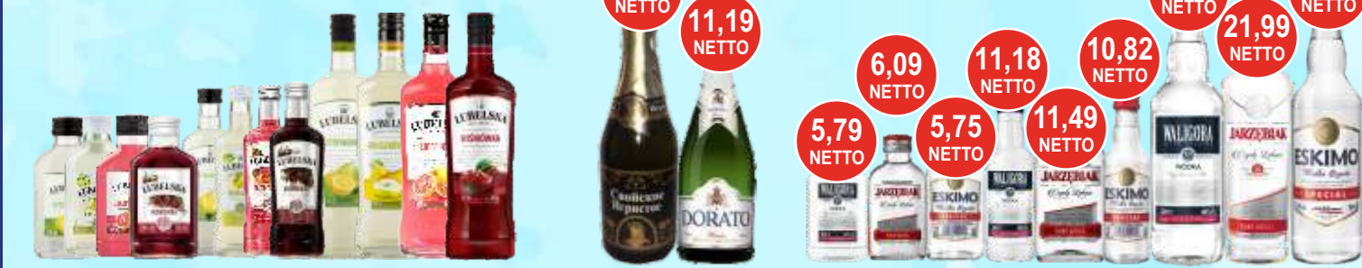
Kolory Lubelskie 0,1 L; 0,2 L i 0,5 L cytrynowka, gruszkówka, grejfrutówka i wiśniówka Szampan Dorato, Swojskoje Igristoje 0,75 L Wódka Waligóra, Jarzębiak i Eskimo 0,1; 0,2 i 0,5 L