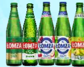
Piwo Łomża Pils, JP, smakowe 4,5% jabłko-wiśnia 0%, Łomża 0%

Przy zakupie 5 op. mix 1 op. Łomża JP Gratis