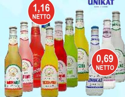
Wody i napoje Unikat 0,33 L