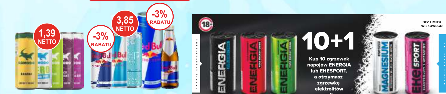
Napoje energetyczne Komodo - 0,25 L różne smaki Napoje energetyczne Red Bull - 0,25 L (bez cukru, Ice) 0,355 L i 0,25 L but. * 1 op. - 24 szt. 10+1 Kup 10 zgrzewek napojów ENERGIA lub EHeSPORT, a otrzymasz zgrzewkę elektrolitów gratis

* przy zakupie 4 op. - 4 pak Gratis 8 op. - 8 pak Gratis